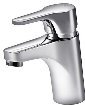
Köksblandare Gustavsberg Nautic